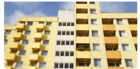
Jedes Apartment hat einen Balkon.