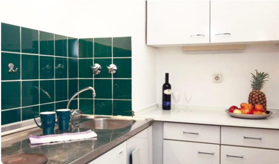
Zweckmäßig und komplett möbliert.

Ein-Zimmer-Apartments im Apartmenthaus Kulbeweg in Berlin-Spandau